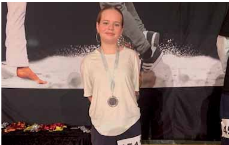
Liva, sølv i hiphop solo.