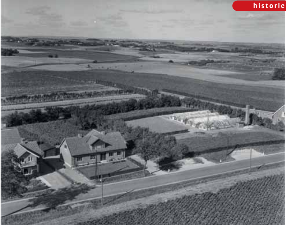
Luftfoto fra 1954, der viser nr. 14 og de tilhørende drivhuse.

ham (moderen var død i 1934), og arvesagen endte med at der blev udstedt arveudlægsskøde til Kristians 15 år yngre bror Ejner.