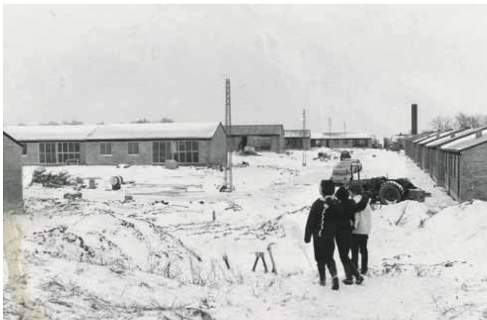
Gartnervænget 1966 Fotograf Børge Venge, Demokraten.