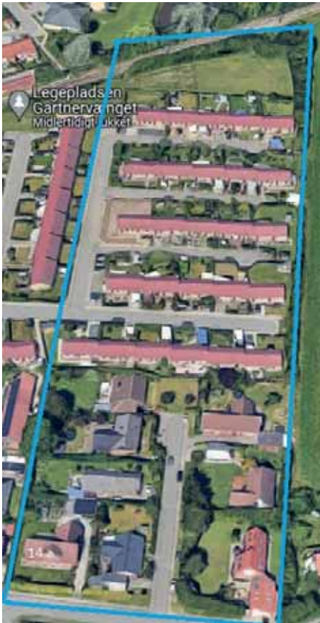
Google Maps 2024 viser det stykke jord, hvor der blev drevet gartneri og som nu er udstykket. Nederst tv er nr. 14 og derefter de syv huse, der blev bygget i 1979. Øverst er boligforeningshusene.

celhusgrunde – Tranbjerg Hovedgade 12A-G.