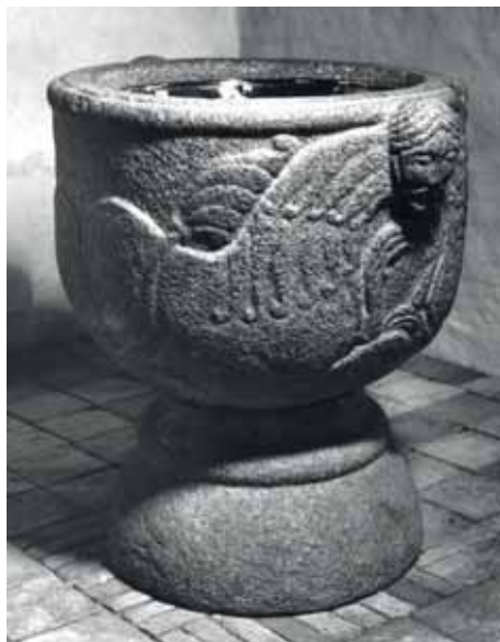
Døbefonten i Tranbjerg kirke. 1967

Vi ser den lille kirke for os udefra – skib og kor med kun små rundbuede vinduer. Mændene går ind ad den flotte indgang mod syd og kvinderne ad den mere beskedne nordindgang. De kommer ind i et rum, der er sparsomt belyst gennem de små vinduer. Der er ingen bænke, ingen prædikestol, ingen altertavle. Alteret er en firkantet sten, der står under det lille rundbuede vindue mod øst. Herfra strømmer lys ind i den lille kirke. Lyset er kirkens ”altertavle”, der virker stærkt i det dunkle rum og forkynder lysets sejr over mørke og død. Foruden dette lys er døbefonten det vigtigste. Den står på en høj sokkel midt mellem mændenes indgang mod syd og kvindernes mod nord. På døbefontens kumme ses to løvepar hver