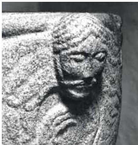
Mandshoved på Døbefonten i Tranbjerg kirke. Foto Poul Pedersen 1967.