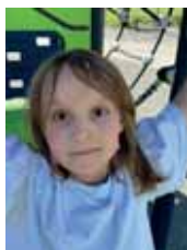
Dicte 9 år