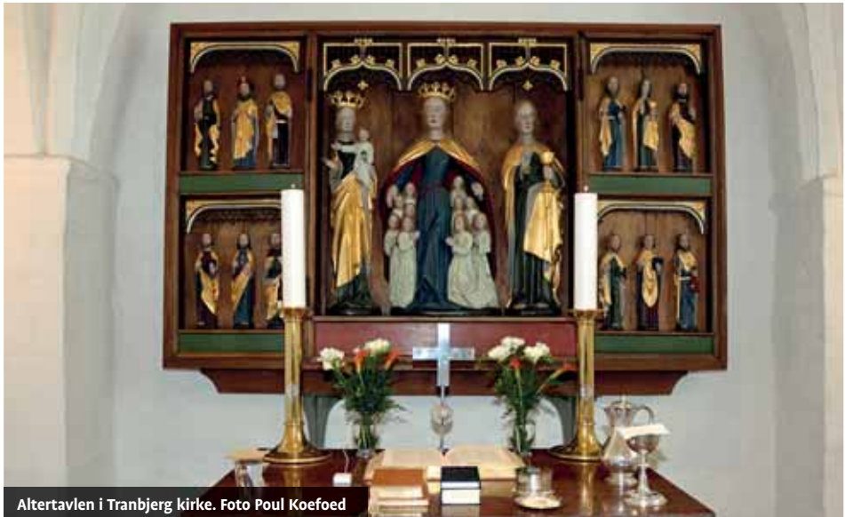
Altertavlen i Tranbjerg kirke.

I 1520 ophænges den valgte altertavle, der er skåret i træ af en mester i Lübeck. Den kommer til at dække det lille rundbuede vindue mod øst, der mures til. Det er oprindeligt en fløjaltertavle, der med fløje kan lukkes hen over midterpartiet. Den er lukket i fastetiden, hvor man ikke må have noget smukt at se på. Man ser bare en stor trækasse. Men Påskedag åbnes den og al dens skønhed kommer til syne. I midten ses de tre hovedpersoner: i midten Sct. Ursula, jomfru Maria med Jesusbarnet på hendes ene side og disciplen Johannes med alterkalken på den anden. I fløjene ser vi de 12 apostle. De fleste har med tiden mistet deres kendetegn (også kaldt attributter). Dog er det muligt at identificere nogle få. I søndre fløj foroven står midt for den skæglose Johannes