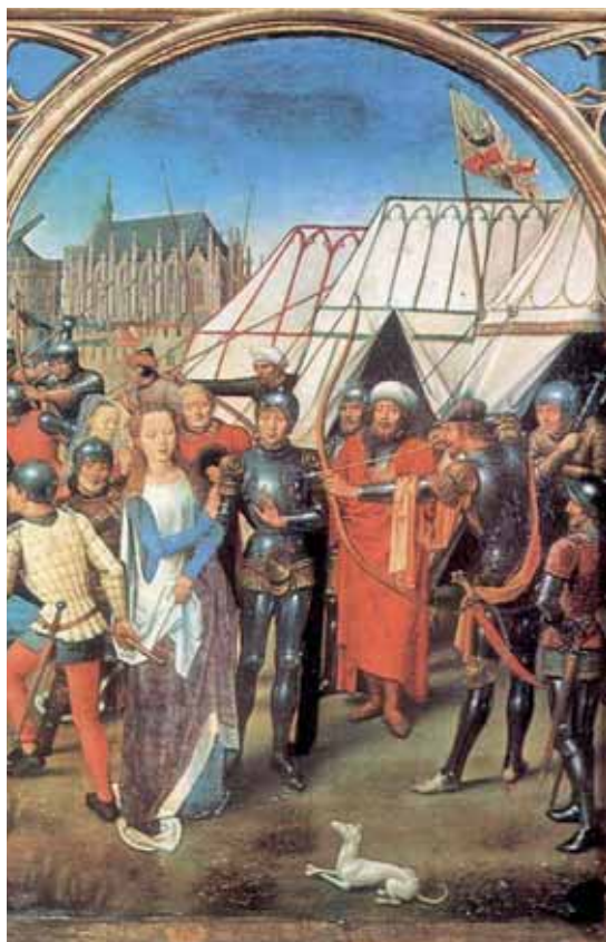
Hans Memlings (1430-1492) maleri af det øjeblik, hvor Sct. Ursula afviser ægteskabstilbuddet fra hunnerhøvdingen, hvorefter han dræber hende med en pil (1489)

Men altertavlen blev bevaret, selv om den i perioder har været anbragt andre steder end på altervæggen. Og den falder både levende og harmonisk ind i helheden i det meget enkle kirkerum.